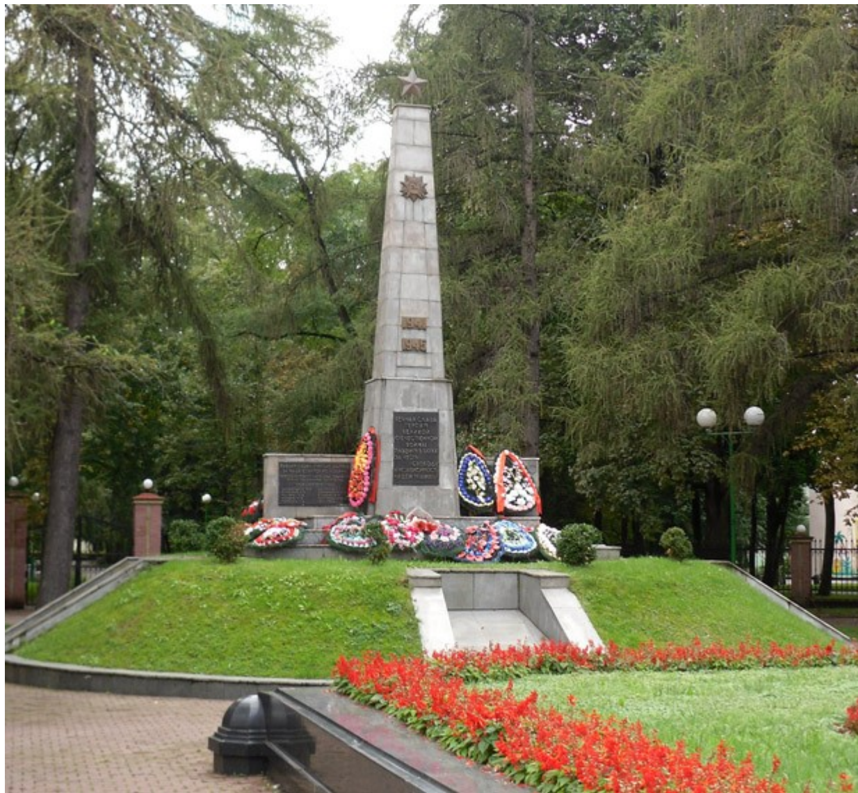
Место захоронения в парке 1 Мая г. Брест

Дополнить или изменить информацию в Книге Памяти можно через обращение в Центральную районную библиотеку