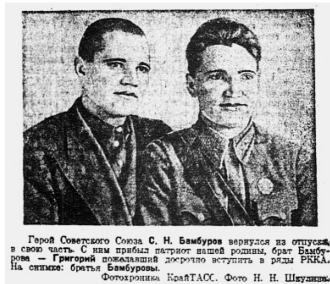
Заметка в газете «Тихоокеанская звезда» №83 от 12.04.1939 г.