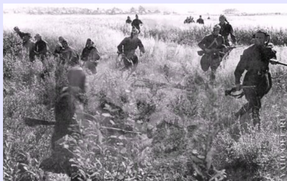
Фильм "Белорусский вокзал"

После этого последовали другие фильмы с его песнями: "Нам нужна одна победа" фильм "Белорусский вокзал", фильмы "Соломенная шляпка", "Женя, Женечка и "Катюша" «Белое солнце пустыни», «Звезда пленительного счастья» и другие.