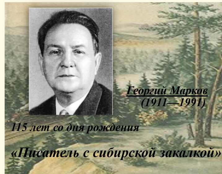
Георгий Марков (1911—1991)