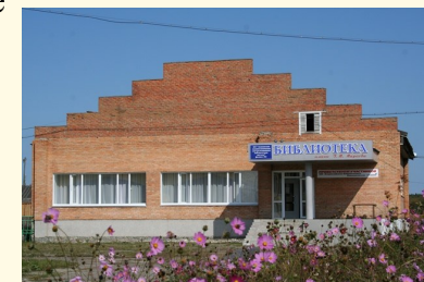
Библиотека имени Г.М.Маркова.

Почётный гражданин Иркутска (1973) и Томска. В 1978 году Г.М Марков передал полученную Ленинскую премию на строительство библиотеки в родном селе Ново-Кусково.