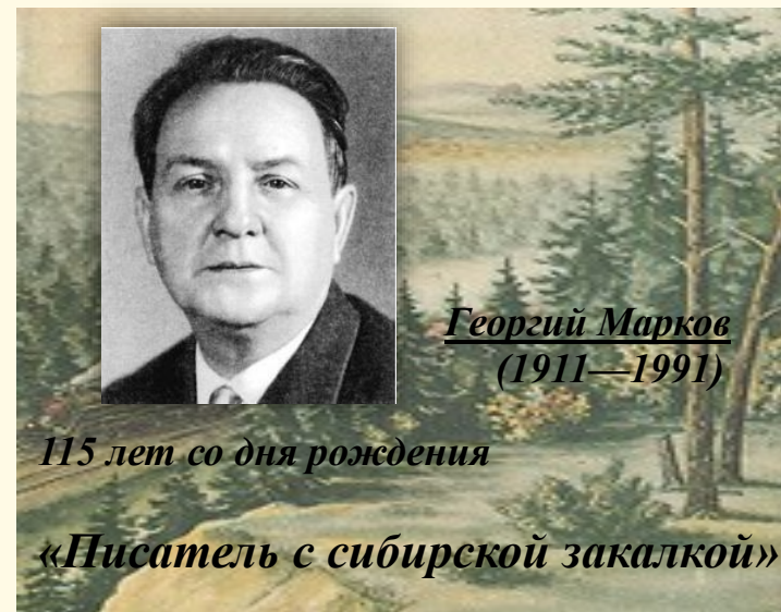
Георгий Марков (1911—1991)